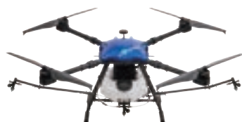
ciDrone AG R-17