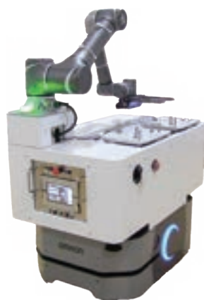
モバイルマニピュレータ (グランデタイプ)