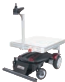
追従運搬ロボット (サウザー)