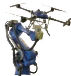
ドローンアナライザー