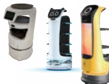
サービスロボット